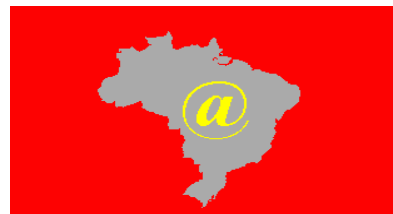
A bandeira do MSR

O recém-criado Movimento dos Sem-Rede tem usado o nosso e-mail para fazer terríveis ameaças. A mais recente dizia que se o jornal impresso não fosse igualzinho ao da Internet, eles nos obrigariam a escutar 48 horas ininterruptas de "Segura o Tchan". Pedimos clemência. A GRÉIA impressa é igualzinha à da Rede. Se houve alguma diferença, prometemos que isso jamais voltará a acontecer. Para o bem dos sem-rede e da nossa saúde mental.